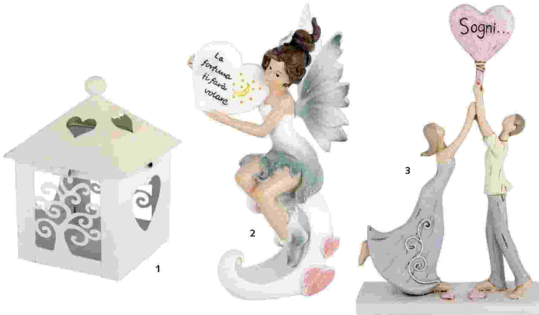
1-2-3. Dalla neocentenaria azienda ETM, alcune originali novità 2020: la scatolina Lanterna in metallo colorato, la fatina Desirella, portafortuna in resina, e la coppia Lovers in polvere di marmo ( www.etm.it )