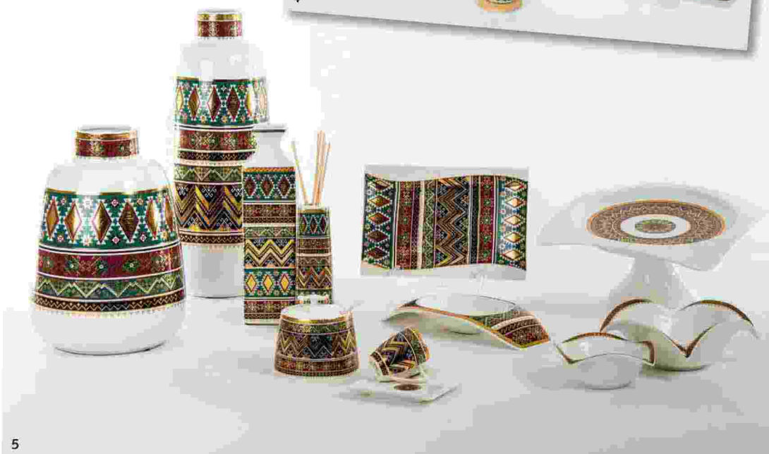
4-5. Due nuove collezioni della Emmebi, oggetti belli, eleganti e utili, per la casa, la tavola e la cucina ( www.emmebi1952.it )