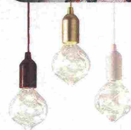
A goccia le LAMPADINE a Led Tira & Accendi [Brandani € 13 set/6 pz].