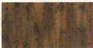
PARQUET in rovere rustico Large piattato e oliato a mano [Unikolegno].