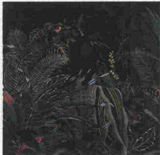
TAPPEZZERIA con supporto vinilico Lost Paradise [LondonArt € 89].

L'effetto patina scalda gli ambienti con il legno rustico, le pareti e i soffitti colorati e... con ricche carte da parati!