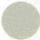
PITTURA opaca per interni Mat Poudré colore Vert Mesclun [Ressource € 40/lt].