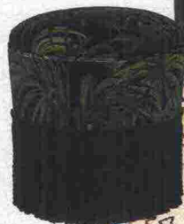
Sartoriale il POUF Palmeral in velluto [House of Hackney, ø cm 44x45h € 1.119].