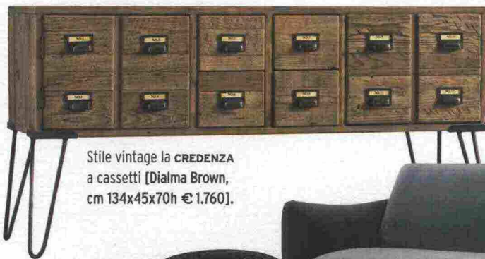
Stile vintage la CREDENZA a cassetti [Dialma Brown, cm 134x45x70h € 1.760].